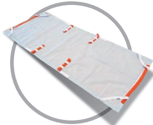
E-600 | סדין מילוט

סדין מילוט נועד עבור אנשים המרותקים למיטתם ויש לפנותם במהירות למקום מבטחים.