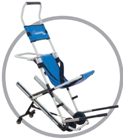
E-400 | כסא פינוי וחילוץ

כסא ידני להורדת אנשים עם מוגבלות בשעת חירום באופן מהיר ובטוח.