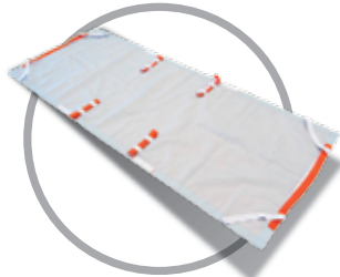
E-600 | סדין מילוט

סדין מילוט נועד עבור אנשים המרותקים למיטתם ויש לפנותם במהירות למקום מבטחים.