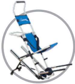
E-400 | כסא פינוי וחילוץ

כסא ידני להורדת אנשים עם מוגבלות בשעת חירום באופן מהיר ובטוח.